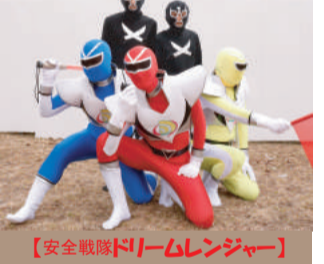
【安全戦隊ドリームレンジャー】